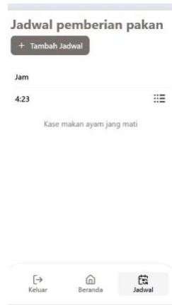
Gambar 3. Halaman Input Jadwal

Halaman ini digunakan untuk mengatur dan memasukkan jadwal pemberian pakan sesuai kebutuhan.