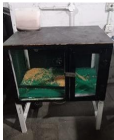
Gambar 1. Rangka Prototype

Perancangan perangkat keras bertujuan untuk menyusun dan mengintegrasikan komponen-komponen fisik yang menjadi elemen utama pendukung sistem yang akan dibangun. Setiap komponen dirancang agar dapat berfungsi secara terpadu sesuai dengan tujuan dan kebutuhan sistem secara keseluruhan. Seluruh perangkat keras tersebut telah dirakit dalam sebuah rangkaian prototipe.