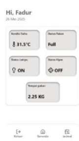
Gambar 2. Halaman Dashboard

Pada halaman dashboard ini ditampilkan informasi mengenai status pakan, jumlah pakan yang telah dikeluarkan, serta kondisi lampu dan kipas. Selain itu, halaman ini juga menampilkan data suhu lingkungan secara real-time